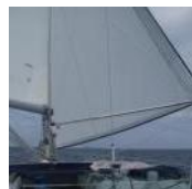
Fast wie im Pass