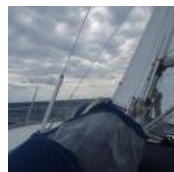
Es trübt sich ei