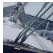
Er frischt auf