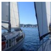
Na, wer ist schneller?