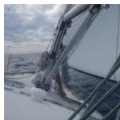
Vor dem Sturm