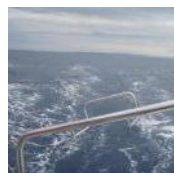
Er bläst sich ein, Er blä